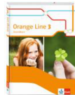
Schülerbuch 7 Grundkurs ISBN: 978-3-12-548173-2