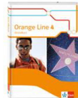
Schülerbuch 8 Grundkurs ISBN: 978-3-12-548174-9